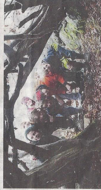
Barnens egenbyggda koja som enligt uppgift är "sval på sommaren och varm på vintern".